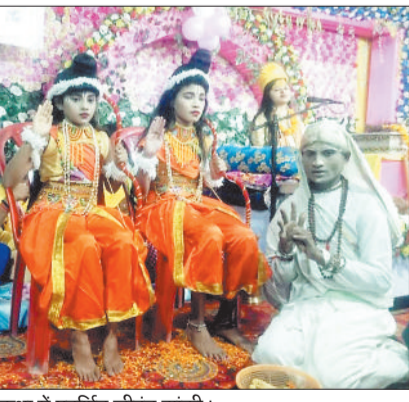
कथा में प्रदर्शित जीवत झांकी।