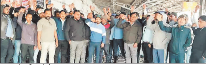
हड़ताल में शामिल लोको पायलट।

कोरबा में ऑल इंडिया लोको रनिंग स्टाफ एसोसिएशन के बैनर तले लोको पायलटों ने 48 घंटे की भूख हड़ताल के बाद काम पर वापसी की है। हालांकि उन्होंने अपनी मांगों को लेकर विरोध प्रदर्शन जारी रखने की बात कही है। लोको पायलटों का कहना है कि केंद्र सरकार ने अन्य केंद्रीय कर्मचारियों के भत्तों में 25 प्रतिशत की बढ़ोतरी की है, लेकिन उनके भत्ते नहीं बढ़ाए गए हैं। उनकी प्रमुख मांगों में लोकोमोटिव में शौचालय की सुविधा का अभाव भी शामिल है, जिससे विशेषकर महिला लोको पायलटों को परेशानी होती है। इसके अलावा पर्याप्त आराम न मिलने से ट्रेन और यात्रियों की सुरक्षा पर भी असर पड़ने का दावा किया गया है। लोको पायलटों की अन्य मांगों में 1 जनवरी 2024 से किलोमीटर भत्ता और टीए में 25 प्रतिशत की बढ़ोतरी और परियर का भुगतान शामिल है। वे किलोमीटर भत्ते के 70 प्रतिशत हिस्से को आयकर से छूट देने