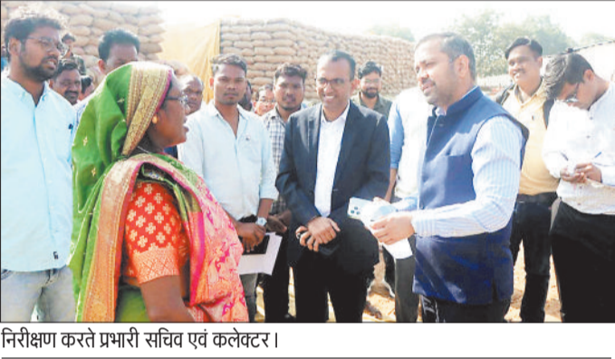
निरीक्षण करते प्रमारी सचिव एवं कलेक्टर।