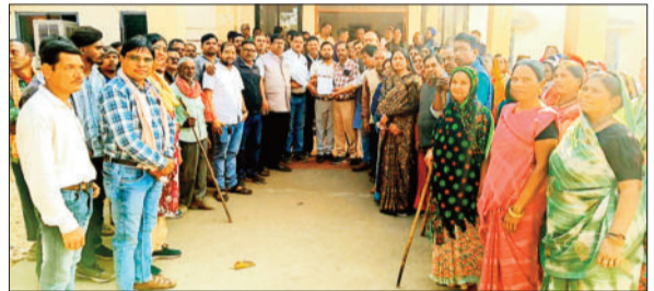
ज्ञापन सौंपते ग्रामीण।