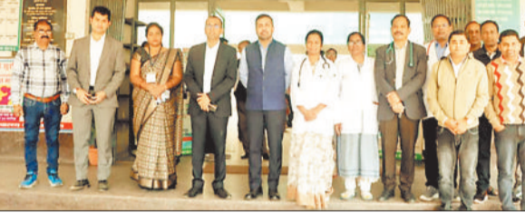
स्वास्थ्य सुविधाओं का जायजा लेते हुए।