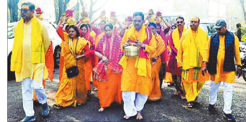
कलश यात्रा में शामिल यजमान व महिलाएं।