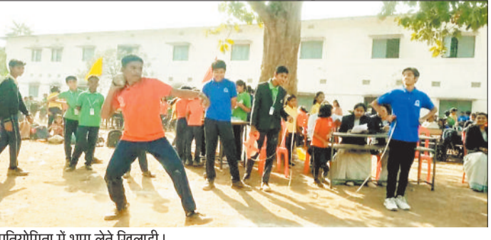
प्रतियोगिता में भाग लेते खिलाड़ी।