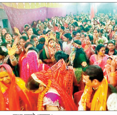
कथा सुनते श्रद्धालु।