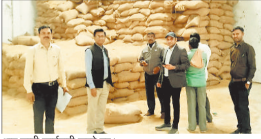
धान जब्ती कार्यवाही करते हुए।